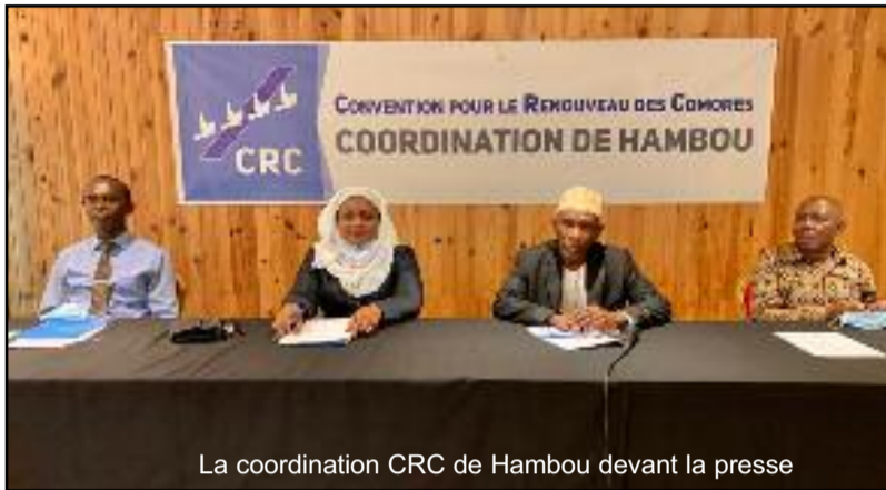
La coordination CRC de Hambou devant la presse

Dans une sortie médiatique, le bureau de la coordination de Hambou de la Convention pour le Renouveau des Comores (CRC) a fait une approche sur la situation politique nationale. Lors de ces échanges avec la presse, les conférenciers ont passé en revue le discours du chef de l'Etat à l'occasion de la fête nationale et selon eux, « cette allocution est à saluer ».