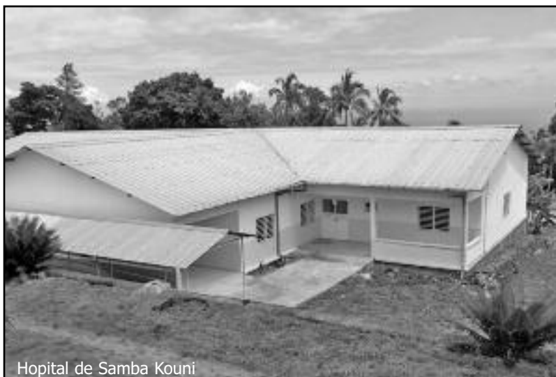
Hopital de Samba Kouni