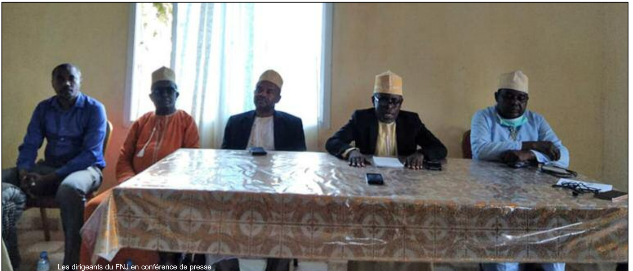
Les dirigeants du FNJ en conférence de presse